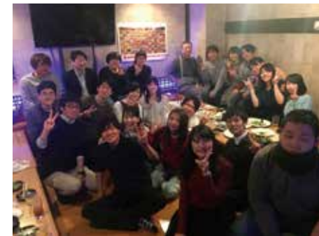
歯学科同期と担任の先生方との飲み会の様子。