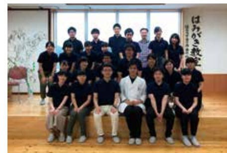
幼稚園ボランティア時の集合写真。