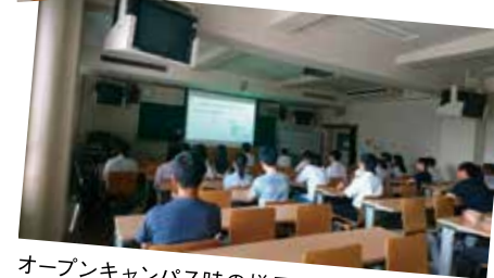
オープンキャンパス時の様子。