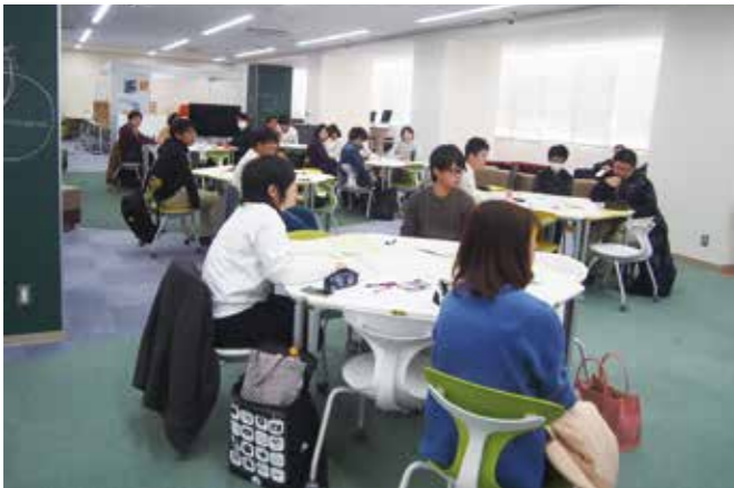
地域創生国際交流会館5階「フューチャーセンター」で開催された「インターンシップ学生向け振り返り会」