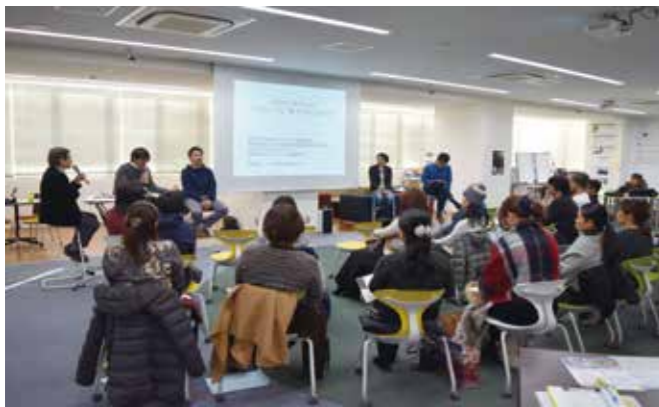
2017まちごとファクトリーのクロージング

また、常三島キャンパスの地域創生・国際交流会館5階には、国立大学初の施設「フューチャーセンター」『A・B A』（アバ）があります。この施設等を活用し、徳島新聞社及び徳島県信用保証協会との連携事業として、地域でスモールビジネスを実践する起業家を創る「まちごとファクトリー」事業を展開し、地域を支える複数