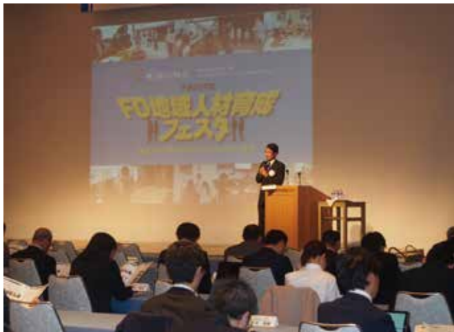
「FD地域人材育成フェスタ」で説明する玉COCプラス推進監