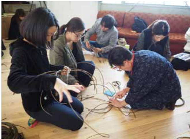
にしあわ学舎で開催された「かずらワークショップ」

の起業家を輩出しています。また、若手事業者や学生等による、助任の丘を利用した「フアー・マーズマーケット」、徳島の伝統文化である阿波人形浄瑠璃の木偶（でく）を3Dプリンターで再現し、新しいスタイルで伝統を継承する「伝統をマイク」事業等、新たな地域貢献の取り組みを行っています。