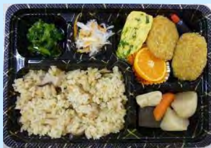
道の駅弁当「かなん冬の恵み」