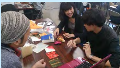
包装デザイン打合せ