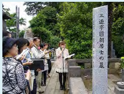
地域巡りガイドの様子