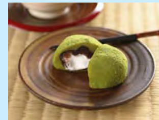
地元名産品「霧の森大福」