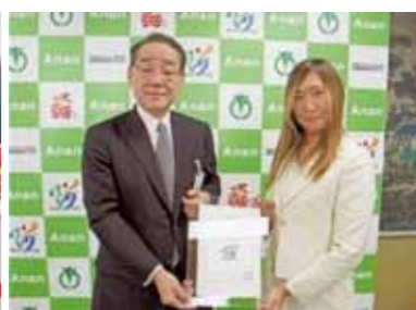
阿南ふるさと大使委嘱式 岩浅市長と