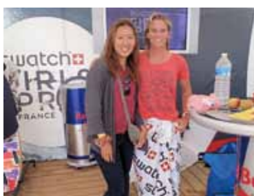
好きなサーファー米国 Courtney Collogueと

日本には、国内中心の「日本プロサーフィン連盟(JPSA)」と、世界組織の日本支社として「ASP JAPAN」という二つのプロ組織があります。ASP(アンシエーション・オブ・サーフィン・プロフェッショナル)にはWCTとWQSというリーグがあり、WQS(ワールドクオリファイイングシリーズ)での上位17人がWCT(ワールドチャンピオンシップツアー)参加資格を得て世界トップを競います。