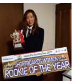
2011年度ルーキーオブザイヤーのトロフィー