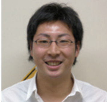
大学院先端技術科学教育部 博士後期課程

地震という自然災害は未知のもので、災害を未然に防ぎ被害を軽減するためにも、地震時の地盤