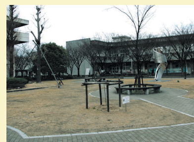
芝生の広場。 ベンチ有り。 夜にバーベキューを していた人も…!