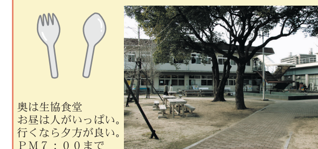
奥は生協食堂 お昼は人がいっぱい。 行くなら夕方が良い。 PM7:00まで