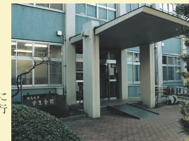
玄関入ってすぐ右に 阿波銀行、徳島銀行 共通のATMが あります。