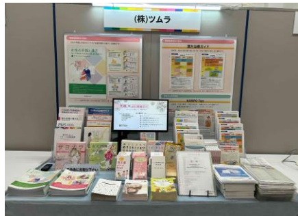
2023年日本女性医学学会学術集会企業展示の風景

【個人情報について】ご記入いただきました個人情報は、株式会社ツムラ医薬品等の情報提供活動のために利用させていただきます。不都合のある場合にはご遠慮なくお申し出ください。なお、個人情報につきましては、安全管理のために必要な措置を講じ、適切に保管・管理を行います。