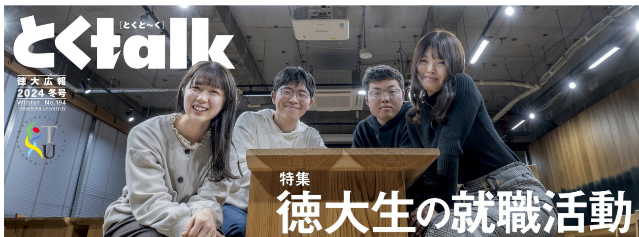
徳大広報『とく talk』(2024年冬号)を発行しました