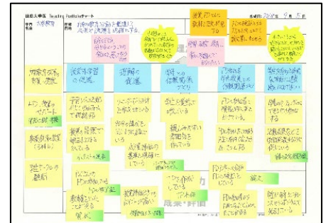
完成した TP チャートのイメージ

ワークショップでは、他者との対話を通してより深い振り返りができ、 多様な教育のあり方について知る ことができます。