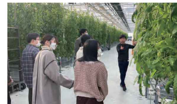
(写真4) 学外エクスターンシップの様子