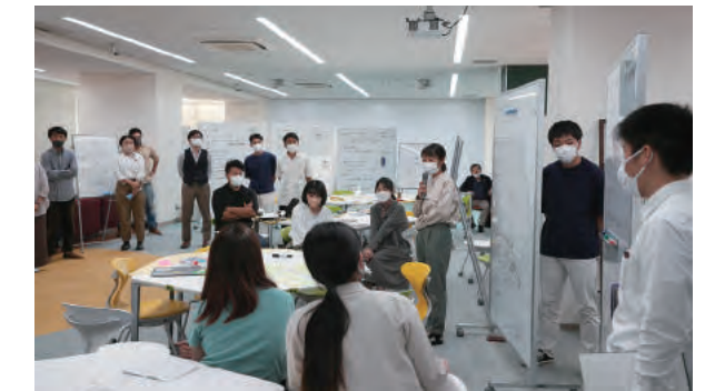
(写真6) 中間報告会の様子