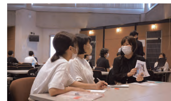
(写真3) 学内エクスターンシップの様子

・課題・フェーズを変えて、学生と接触を持つうちに、同じ学生が毎回当社に接触していただけることで、当社に興味関心を持ってもらえていると思える学生が絞り込まれたと思う。学生と少しでも交わりを持って、業界・業種・業態を少しでも知ってもらおう機会になった。