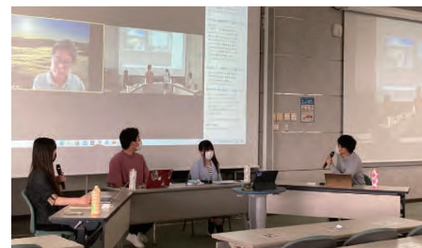
(写真2) 共同授業トークセッションの様子