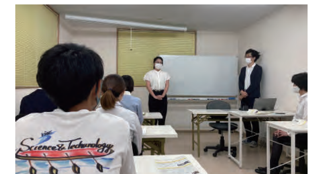
(写真5) インターンシップ生入社式の様子

昨年度に引き続き、事前学習からインターンシップ、事後の振り返りまで「課題・レポート・ディスカッション」を繰り返す「寺子屋式指導法」によるインターンシップ「実践型インターンシップ」を教養教育科目として開講した。本年度のインターンシップは新型コロナウイルスの影響が見込まれていたため、当初よりオンラインで進めていくことを想定しプロジェクトを設計した。学内教職員4名がドン(学内メンター)として参加するとともに、14名の学生が4機関で課題に取り組んだ。最終報告会では、参加企業・団体からは、プロジェクトを通して会社としての新たな取り組みに関して seeds となる成果物が生まれたこと等についてコメントがあり、学生からは実務や経験を通して学びを得たという主旨の感想があった。