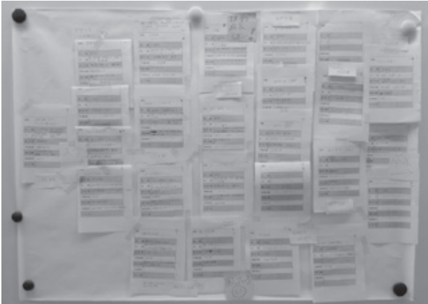
図3 大学全体で実施されている学習支援 (グループワーク)

このセッションでは、各大学の特徴を明らかにするために、それぞれが書き出した支援をグループ内で分類作業を行った(図3)。グループごとに異なる3つの観点①卒業から入学までの時系列、②支援内容、③支援対象で分類された。